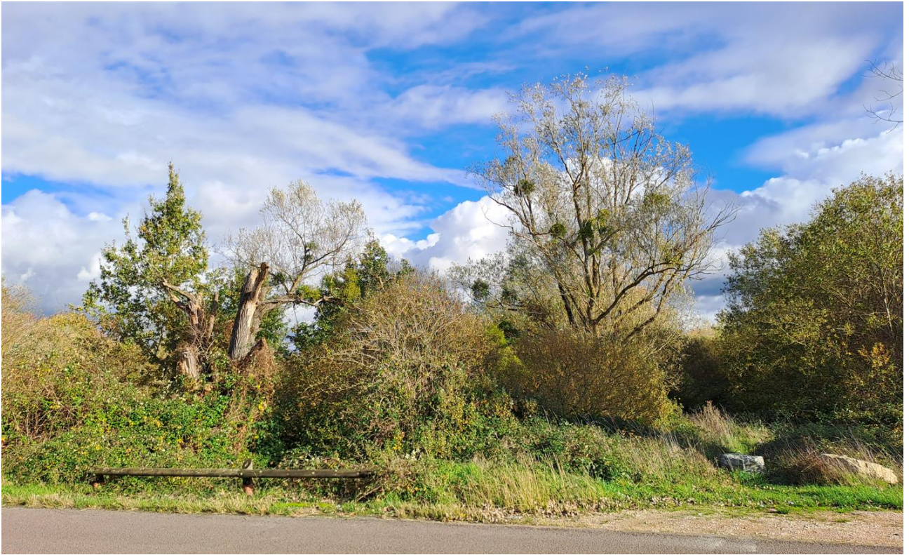
Photo du site depuis la rue de Corcelles, centrée sur le ruisseau du Bois